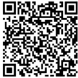
市内地域型保育事業マップ