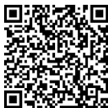
鳥栖市内の認定こども園マップ