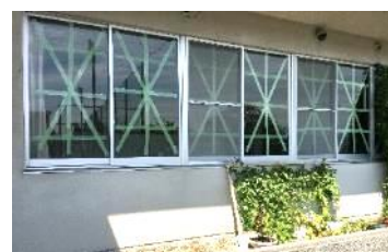
台風10号に備えて(センター研修室)