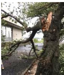
台風9号で折れた桜の枝(センター東側)