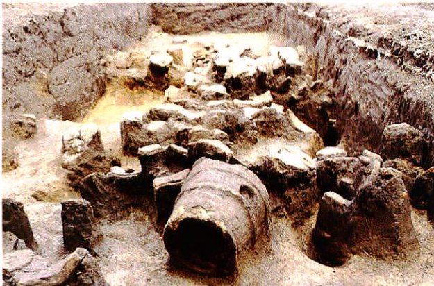
岡寺古墳遺物出土状況

岡寺古墳も前方後円墳です。しかし、現在では農業用池などでかなり削られ、周りからは前方後円墳の形をみることはできません。この古墳からは九州では珍しい巫女・武人・馬・鶏・猪・鳥・盾・馬具などのさまざまな形象埴輪が出土しています。剣塚古墳・庚申堂塚古墳については、昭和50年2月24日に県指定史跡となっています。