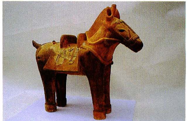
岡寺古墳出土の埴輪（復元）