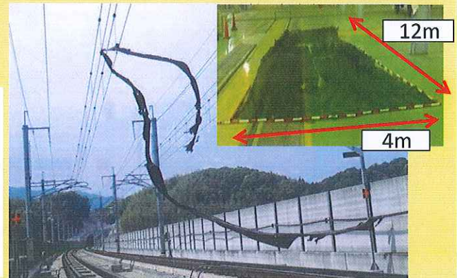
〔電線に引っ掛かった農耕用シート〕