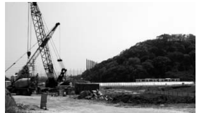
新たな交通拠点としての可能性が探られる現在建設中の新鳥栖駅(仮称)

研修団」への補助金▽スポーツで優秀な成績を残した選手・団体、地域スポーツの発展に貢献している団体の活動を奨励する「鳥栖市スポーツ振興基金」積立金」などです。