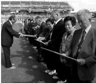
結婚した日の新聞を懐かしそうに読む参加者