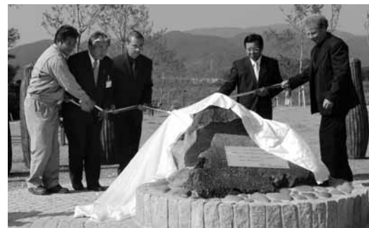
モニュメント完成披露式の様子(10月31日)

すでに悠々自適の身なのにボランティアなどで忙しいのですが、気分転換にたまにはチェロを弾いています。鳥栖市の今後益々の躍進を遠く東北の地から祈っています。