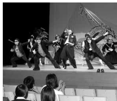
趣向を凝らしたパフォーマンス