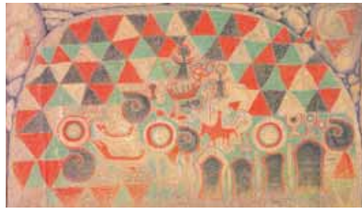
田代太田古墳壁画模写

この作品は今年の11月、山口県で開かれた「国民文化祭・やまぐち2006演劇祭」でも公演されました。 詳しくはミュージカル事務局 ☎080・6415・9979