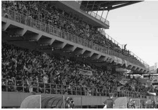
サガンサポーターで埋め尽くされたスタンド

J2公式戦第四十八節「対湘南」戦が十一月十二日、鳥栖スタジアムで開かれました。 今回の試合は、子どもも夢を実現する「夢プラン21」に採用された「鳥栖スタジアムを満員にしたい」の対象試合。夢を発案した鳥栖北小三年の児童六人は、ス