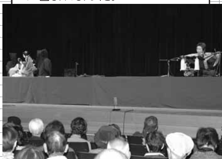
清和文楽館の人形浄瑠璃

また、熊本県山都町にある清和文楽館の人形浄瑠璃が特別出演し「傾城阿波の鳴門」を上演。会場は江戸時代のような雰囲気になりました。