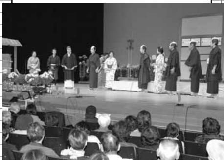
熱演する市民劇団員