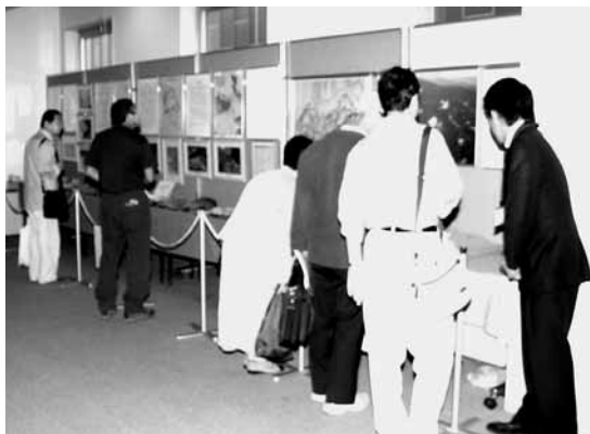
展示された発掘資料を見る参加者

鳥栖市をPRする大きな機会となりました。次回は、このシンポジウムについて詳しく紹介いたします。