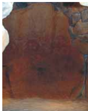
ヒヤーガンサン古墳壁画

ヒヤーガンサン古墳も6世紀後半代に造られた、珍しい彩色壁画系装飾古墳の一つ。直径約20mの円墳で、石室内に赤色の装飾文様が描かれています。 ヒヤーガンサン古墳石室は事前予約により常時見学が可能ですが、田代太田古墳は通常非公開です。 この機会に2基の装飾古墳を見比べてみませんか。 12月10日(日) 午前10時〜正午 午後1時