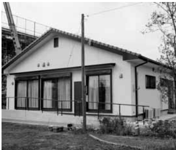
あさひ新町公民館

平成19年度に開設予定の「市民活動センター(仮称)開設準備費 来年4月8日に行われる予定の「県知事・県議会議員選挙」経費 北部丘陵新都市に新設する小学校建設工事の監理業務委託料 あさひ新町公民館の新築工事などに対して支給する「公民館類似施設整備補助金」 来年1月21日に開