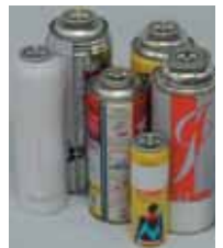
スプレー缶の発火事故が相次いでいます

市民協働推進課(☎85-3576)では、毎週月曜日から金曜日まで消費生活苦情相談を受け付けています。お気軽にご連絡ください。