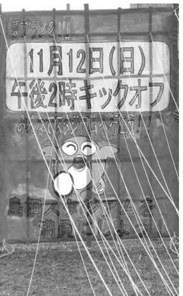
試験的に作成した「大風」

とる 東公園(今町) 申し込み 12月28日までに 夢プラン21実行委員会事務局(☎85・3576)へ