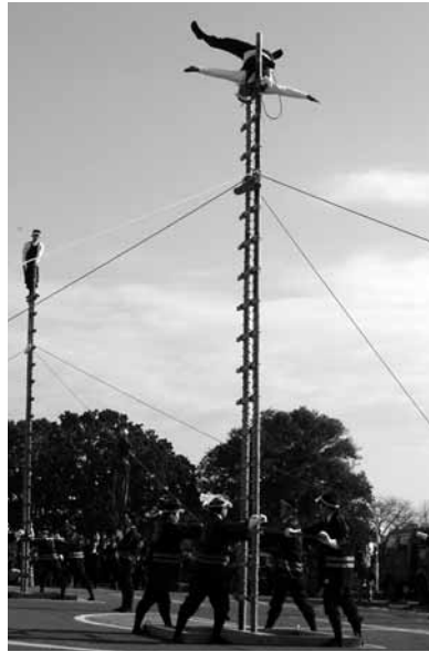
消防妙技の数々が披露されます