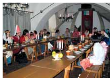
独ツァイツ市へ子ども訪問団員を派遣(8月3~17日)