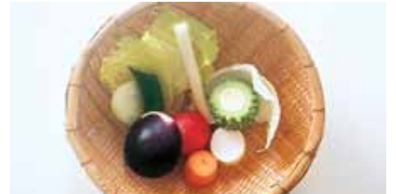
野菜の1日の摂取量 350g