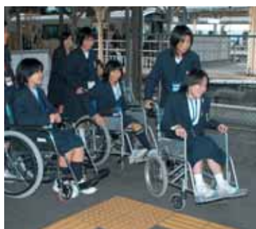
車いす体験をする児童