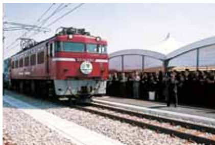
鳥栖貨物ターミナル駅が開業(3月23日)