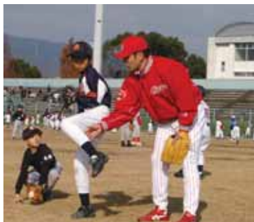
緒方選手の指導を受ける球児