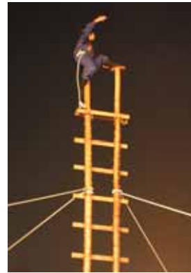
のり乗りの女性消防団員がはしご乗りに挑戦。本練習をする。

ます。市中パレードは、ジョイフルタウン鳥栖東側道路を午前9時に出発。市役所まで約2キロの道のりを、鳥栖工業高校によるマ