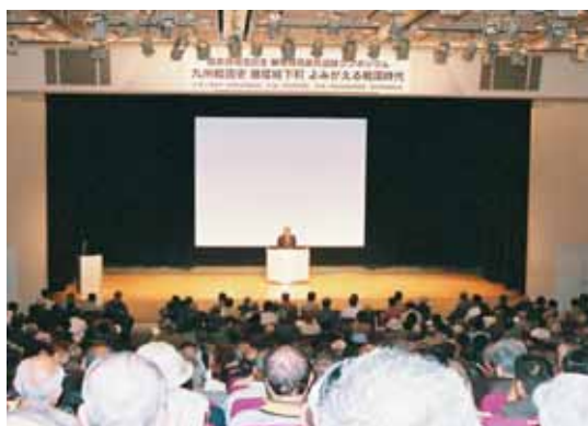
500人にも及び参加者があった「勝尾城筑紫氏遺跡」国史跡指定記念シンポジウム（10月29日、福岡市）

当日は五百人に及び参加者があり、非常に盛況な中、聴衆は安部氏の講演を堪能された様子でした。