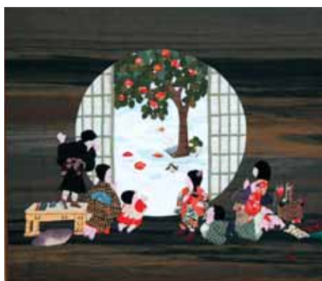
1つの作品を完成させるのに数カ月もかかります

始め、昭和六三年から五年間、福岡市で布絵の講師として多くの生徒さんに教える傍ら、個展を開いたり、さまざまな手芸コンテストに入賞したりしています。それらの作品