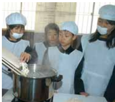
うどんをゆでる子どもたち