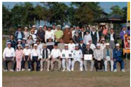
市民大運動会、鳥栖地区が2連覇(10月8日)