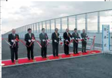
テープカットをする関係者