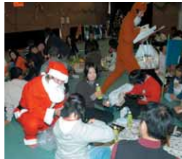
サンタクロースからプレゼントをもらう参加者