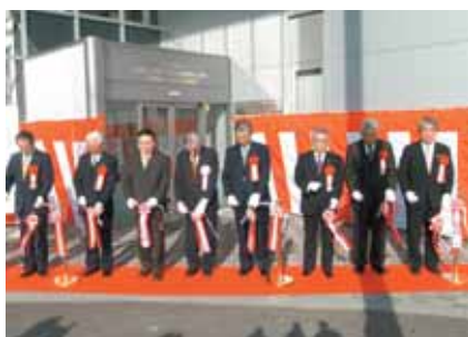
九州シンクロトン光研究センター開所式(2月17日)