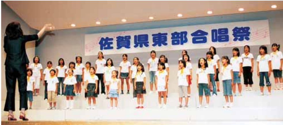
子どもから大人までが楽しめる合唱祭「佐賀県東部合唱祭」