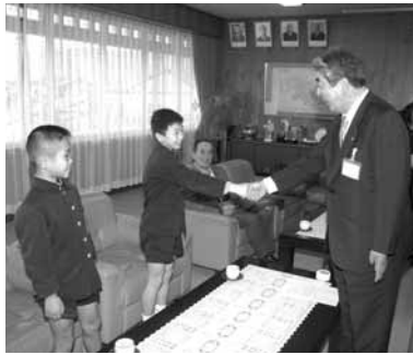
2人を激励する牟田市長