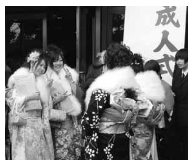
友人と写真を撮る新成人