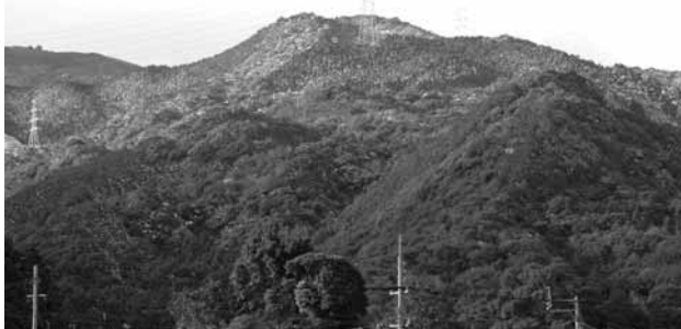
中世の山城「勝尾城」