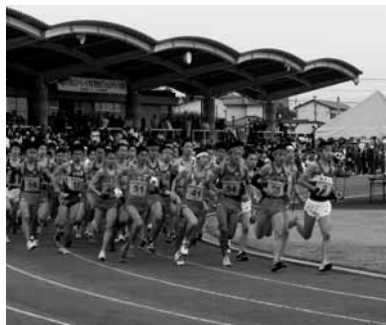
一斉にスタートする参加者(10キロ公認高校生の部)