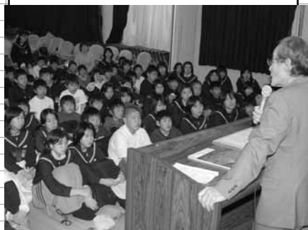
「鳥栖空襲」の話に聞き入る小学生