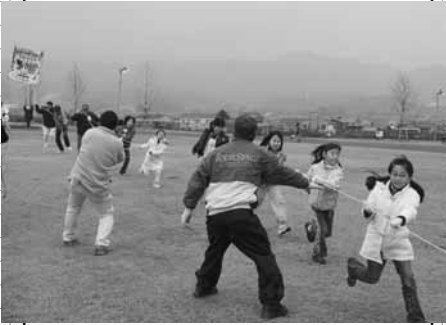
大凧をあげる子どもたち