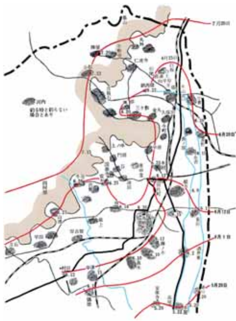
「三養基郡東部に於けるカヤの釣り始め」図

このようなわずかな標高差や気温の変化、川や水田の有無などが蚊の発生に影響を与えています。