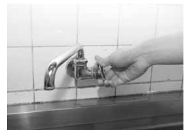
蛇口を小まめに閉めましょう