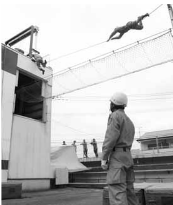
厳しい訓練に励む消防職員

職種・職務内容 消防A・消防B・消防C 消防に関する一般事務と火災予防、火災鎮圧、人命救助、救急業務など 採用予定人員 消防A・B・C合わせて5人 受験資格 消防A 昭和58年4月2日から昭和61年4月1日までに生まれた大学卒業者（来年3月卒業見込みの者を含む） 消防B 昭和58年4月2日から昭和63年4月1日までに生まれた短大卒業者（同卒業見込みの者を含む） 消防C 昭和58年4月2日から平成2年4月1日までに生まれた高校卒業者（同卒業見込みの者を含む） 消防A・B・Cともに他にも条件があります。詳しくは試験案内をご覧ください 第1次試験 9月16日（日）午前9時半、鳥栖・三養基地区消防事務組合消防本部 集合（学科、体力試験） 第2次試験 11月初旬（作文、適性検査ほか） 受付期間 8月1日（水）から8月17日（金）まで 申込書の請求 申込書などは鳥栖・三養基地区消防事務組合総務課、鳥栖市役所などで交付します。郵便で請求する場合には、封筒の表に「採用試験申込書請求」と朱書きし、必ず120円切手を貼ってあて名を明記した返信用の封筒（A4サイズの入る大きさ）を同封して、同組合総務課（〒841 0037 鳥栖市本町3丁目1488番地1）へ 問い合わせ 同組合総務課（☎83・7994）