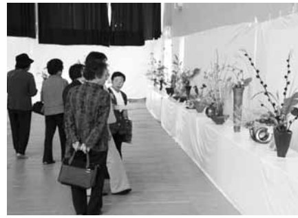
昨年の市民文化祭

市では11月3日(祝)から同14日(水)まで、サンメッセ鳥栖などで「第46回鳥栖市民文化祭」を開きます。そこで、文化祭の舞台部門の出演者と展示部門の出品作品を募集します。詳しくは市民文化祭実行委員会(市民文化会館内 ☎85・3645)へ。