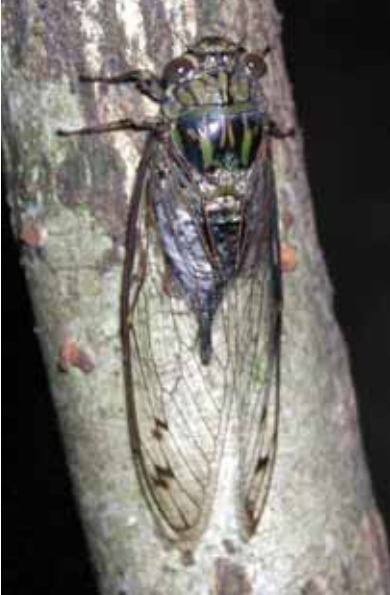
夏の終わりを告げるツクツクボウシ

腹痛、食傷、暑気あたりに効くとして、大黄(ダイオウ)、黄連(オウレン)、熊胆(ユウタン)などが配合された反魂丹。越中富山の反魂丹。2代目藩主、前田正甫(まへだまさとし)公によって製造と販売が産業化され、諸国