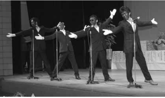
楽しいパフォーマンスの数々(昨年)

第46回鳥栖市民文化祭実行 委員会では市民文化祭の中で 「職域・グループ対抗歌合戦 2007」を開きます。