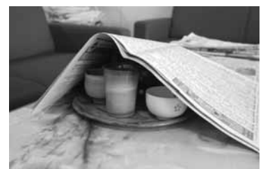
食器は新聞などで覆いましょう