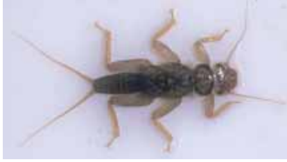
きれいな水 の指標生物「カワゲラ」の幼虫

鳥栖市の河川で見られるのは、I(きれいな水)の指標生物では、カワゲラ、ヒラタカゲロウ、ヘビトンボ、サワ