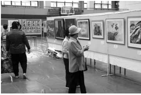
市民体育館で行われる絵画などの作品展

市民文化祭が11月3日・4日・14日に開かれます。3日にサンメッセ鳥栖で開かれる式典では市政功労者、市文化連盟芸術文化賞の授賞式が行われます。また、同日午後6時から好評の「職域・グループ対抗歌合戦」が開かれるほか、舞台合同発表会、合同茶会、文化講演会が開かれます。展示部門の合同作品展は、例年どおり市民体育館や多目的ホールで実施。最終日の小・中学校音楽祭は、基山町民会館で開催されます。