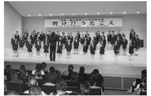
小・中学校音楽祭は基山町民会館で開催