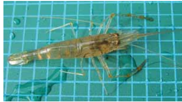
少しきたない水の指標生物スジエビ