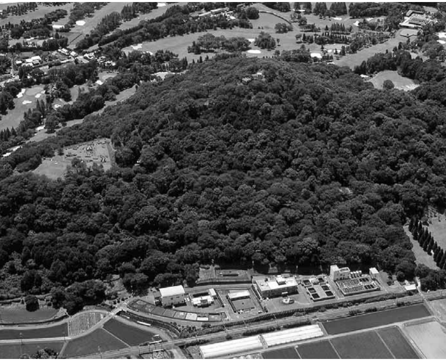
「佐賀の乱」の戦闘の舞台となった朝日山

います（『佐賀征討戦記』、明治八年、陸軍文庫）。 そして翌二十二日、政府は軍を三手に分けて朝日山に陣取る佐賀軍を攻めています。長崎街道を進み轟木宿に入る軍、宿村付近を経由する軍、古賀村・牛原村・山浦村を経由して朝日山の背後に迫る軍です。