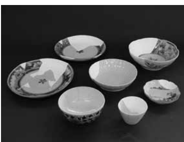
田代代官所跡から出土した食器

昨年行われた田代代官所跡発掘調査の成果を、現存する代官所の公文書類とともに展示・紹介しま