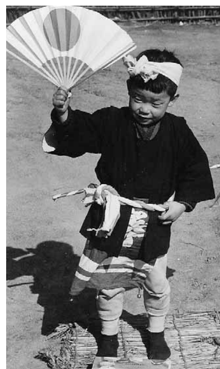
昭和36年当時の「道行きばやし」