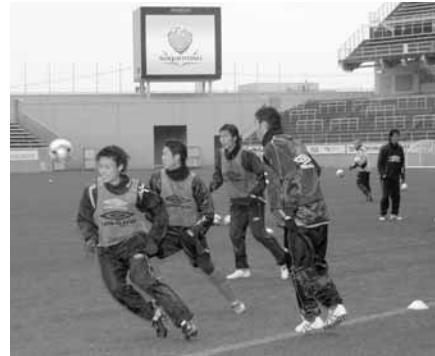
1月20日にベストアメニティスタジアムで行われた初練習