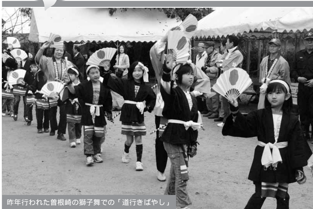
昨年行われた曾根崎の獅子舞での「道行きばやし」