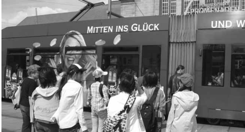
平成18年の交流事業の様子