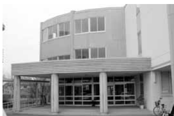
九州環境福祉医療専門学校田代校