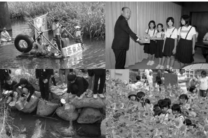
平成19年度の「夢プラン21」で実現した子どもたちの夢

連絡先 保護者名を明記の上、市民協働推進課(〒841-8511鳥栖市宿町1118番地)へ郵送または持参してください。当日消印有効。審査の際に、かな