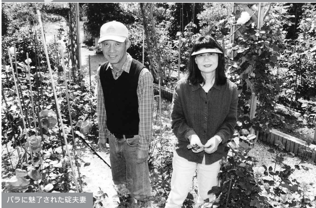
バラに魅了された碓夫妻