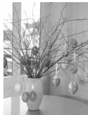
イースターツリー

イースター(復活祭)とは、ドイツでクリスマス次に大切な家族のお祭りのことです。イースターでは親子で色を塗った卵やウサギを飾り、楽しい時を過ごします。