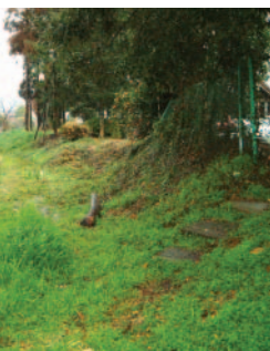
養父八幡神社西境の高まり

また室町時代には、九州探題領の一部である養父村を、対抗勢力の少弐氏から筑紫氏が領地として承認されており、筑紫氏の鳥栖市域における最初の成長基盤となっていたようです。