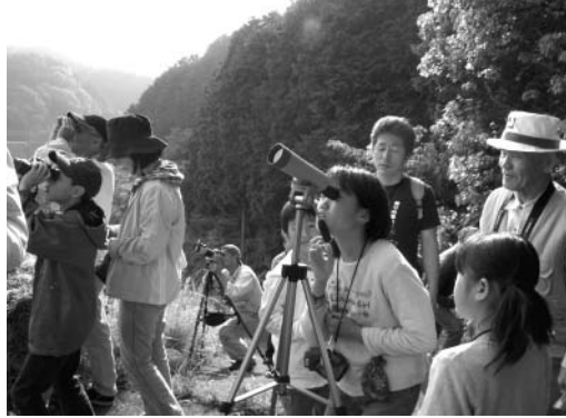
バードウォッチング（昨年）

市では愛鳥週間（5月10日から同16日まで）中の日曜日を「鳥の日」と制定し、鳥にちなんだ催しを実施しています。今年もバードウォッチングと工作教室（鳥の巣箱づくり）を行います。参加無料。 とき ● 5月11日（日）午前7時～ ところ ● とりごえ荘、河内ダム一帯（河内町） 定員 ● 40人 その他 ● バードウォッチングのみの参加も可能。雨天時は工作教室のみ行います