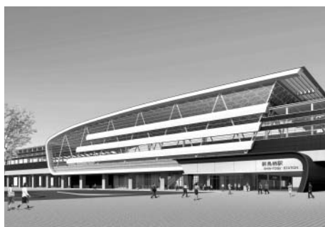
新鳥栖（仮称）駅のイメージ図

市では3月6日まで「市 報とす」「市ホームページ」 で九州新幹線新駅の名称案 や意見を募集しました。 その結果、92人の応募者 から134件の名称案や意 見が寄せられました。多数 のご応募ありがとうございました。