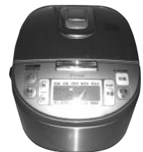
炊飯器は家族構成に合ったサイズを選びましょう

また、容量が大きいものほど消費電力も増えます。1回の炊飯容量をもとに、家族構成に合ったサイズを選びましょう。