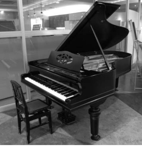
フツペルのピアノ