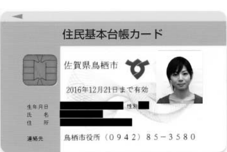
住基カード（顔写真付き）

部門 ●①一般 ②年齢不問、事前音源審査あり ③ジュニア部門 ④小学1・2年生、小学3・4年生、小学5・6年生、中学生、高校生