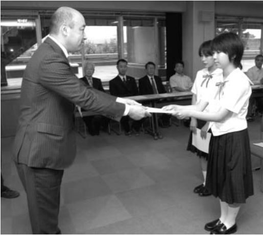
採用決定通知書交付式（5月30日）