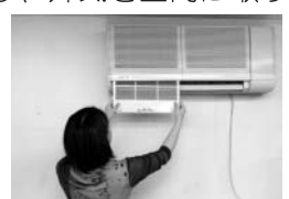
フィルターは2週間に一度掃除しましょう

室内の空気を外に出し、外気を室内に取り込む室外機。その周りや上に物を置くと、冷房効果が弱まり、余計な電気を使います。室外機の周囲は整理整頓を心掛けましょう。