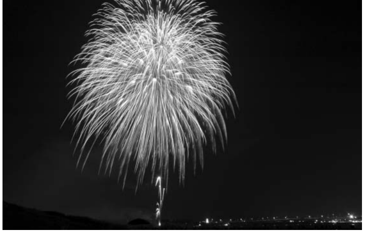
夏の夜空を花火が彩ります