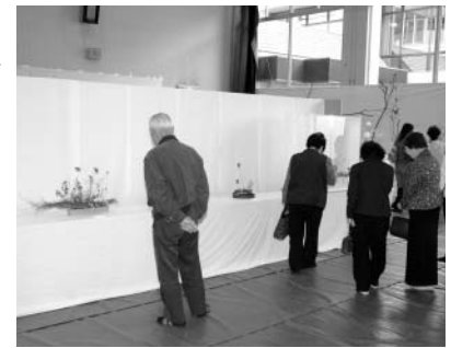
多くの人を訪れた展示部門