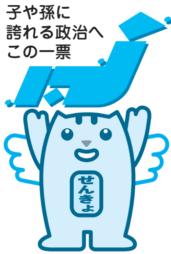
明るい選挙イメージキャラクター 「選挙のめいすいくん」