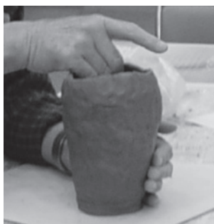
手軽に陶芸を楽しめます

内容 ● 粘土遊びの感覚で簡単に陶器を作ります 定員 ● 20人(先着順) 持ってくるもの ● エプロン 材料費 ● 1作品1500円