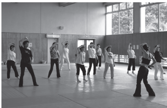
音楽に合わせて楽しくウエストシェイプ!!

市総合型地域スポーツクラブ設立準備委員会では、生涯にわたり心身ともに健康な生活を楽しめるまちづくりを目指して、各種運動教室を次のとおり開催します。 申し込みはいずれも事前に同委員会事務局へ。 ■インナーダンス教室 対象 ● 市内居住者 とき ● 9月7日以降の毎週月曜日(全8回) 20時～21時30分 ところ ● 基里公民館