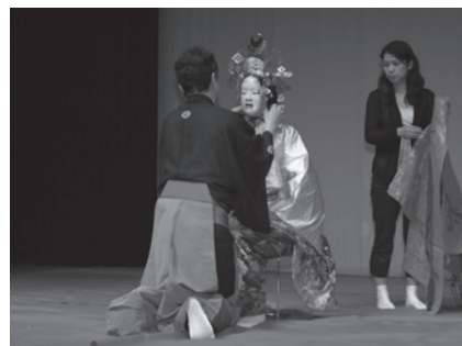
実際に衣装を着て大変身 (昨年の様子)

出してみよう!「能」の楽器体験▽みてみよう!能楽師の変身術▽もういちど、うたおう!鑑賞と地謡体験 その他 ● 参加費無料、事前申し込み不要