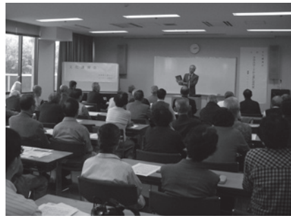
昨年の文化講演会の様子

長崎街道など江戸時代の交通によって鳥栖地域が、人・物が行き交うまちであったことにふれます。第2部のパネルディスカッションでは、中世以来の「交通要衝のまち・鳥栖」の歴史性や地域的特性を鳥栖市誌執筆者が語ります。