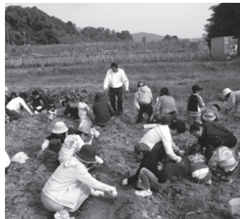
サツマイモを収穫して料理します

とき ● 11月1日（日）9時30分～14時 ところ ● のうのう村チャレンジファーム（立石町）、鳥栖・三養基西部リサイクルプラザ（みやき町） 持ってくるもの ● 米カップ 1/2（1人当たり）、エ