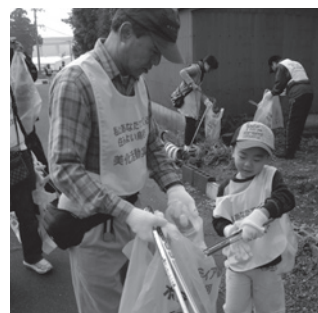
みんなでまちを美しく