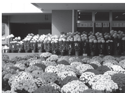
美しい菊を咲かせませんか

とき ●11月15日から来年10月17日までの毎月第3日曜日、10時～12時 ところ ●鳥栖・三養基西部リサイクルプラザ(みやき町) 内容 ●土作り、挿芽要領、中鉢への移植、ヤナギ芽処理、花蕾の選び方、開花までの要領など 定員 ●20人(先着順)