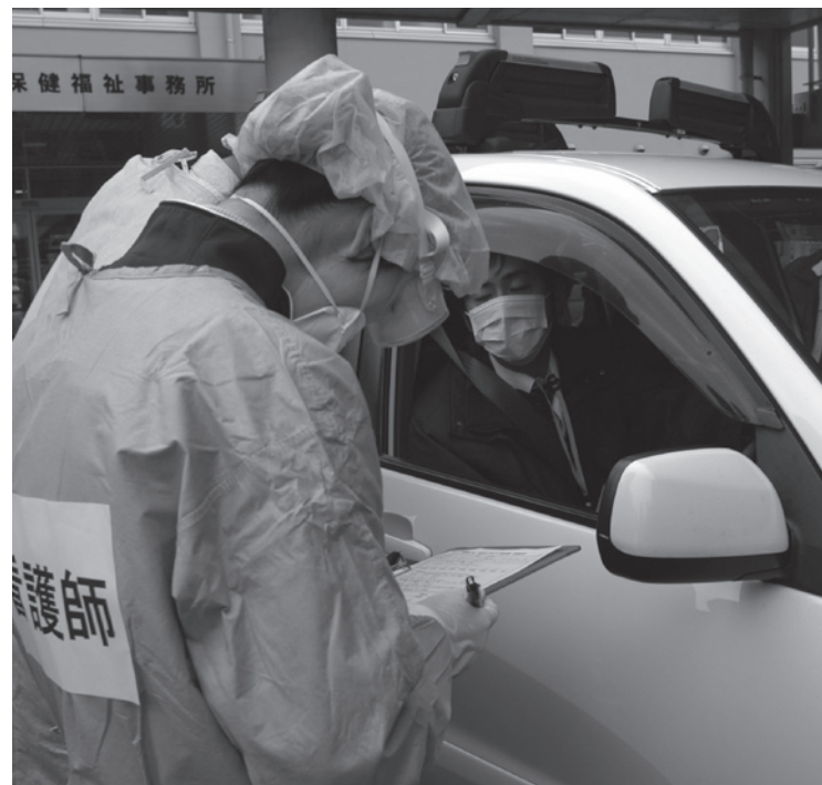
ドライブスルー方式発熱外来設置の対応訓練

鳥栖三養基管内では、鳥栖保健福祉事務所が事務局となり、医師会、薬剤師会、消防事務組合、警察署、病院、市町などの関連機関で構成されている鳥栖三養基