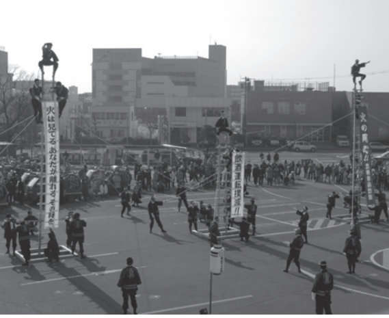
女性は華麗な舞を、男性は力強い演技を披露します

その後、午前10時ごろから市役所前広場で、『古式消防はしご乗り』を行います。例年大盛況の女性消防団員によるはしご乗りを今