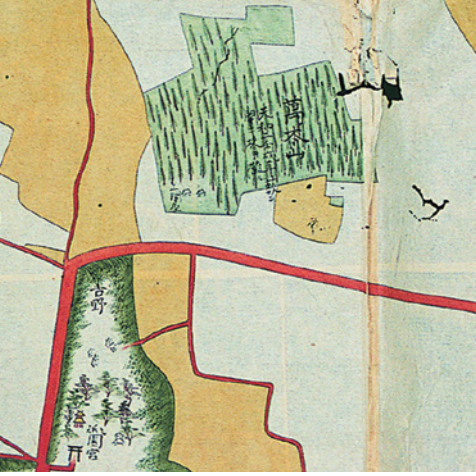
さんげん山の絵図

しかし、原料の榧（はぜ）実を他藩より安く買い取り、農民や蠟屋株仲間から反発を受けます。また、榧の売買に使われた日田の