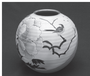
公売を予定している花瓶

前10時～午後4時 ところ ● 市役所市民ホール その他 ● 下見会以外で公売物件を直接見る機会はありません