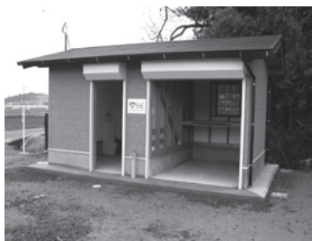
新しく設置されたトイレ

④職業 ⑤電話番号を記入の上、情報管理課へ、はがき ①住所 ②氏名 ③年齢 ① 2月27日(金) ② 2月27日(金) ③ 85歳以上 ④ 12人 ⑤ 100円分