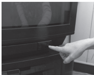
主電源は小まめに消しましょう

待機電力とは、家電製品を使用していない時のリモコンの指示待ちやタイマー・時計表示などのために消費される電力のことです。家庭一世帯あたりの消費量は年間の全消費量の約7%とされています。