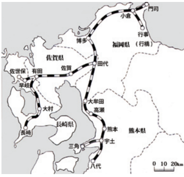
1888年5月の九州鉄道会社予定線路図

さて、北部九州の鉄道敷設計画は、明治十五年ごろから福岡県や熊本県で議論されてきました。しかし佐賀県では、平坦地が多く、水運に便利のため運送には差し支えないとして、鉄道