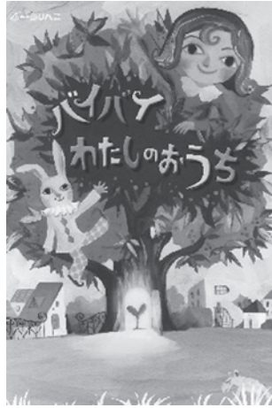
家族のきずなを描く物語です