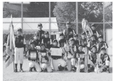
優勝した元町Aチームの皆さん

第69回鳥栖市少年野球秋季大会が10月25日・31日、11月3日・7日の4日間、市内の各グラウンドで行われ、25チームが熱戦を繰り広げました。結果は次のとおりです。 優勝=元町A▽準優勝=古賀町▽3位=藤木町、神辺町