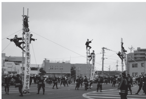
早春の空を華麗な演技で彩ります

鳥栖市消防団では、1月10日(日)に消防出初式を行います。市中パレードは、フレスポ鳥栖(旧ジョイフルタウン鳥栖)東側道路を9時に出発。市役所まで約2kmの道のりを、鳥栖工業高校によるマーチングバンドを先頭に、はしご車をはじめとする24台の消防自動車とともに消防団員らが行進します。その後、10時ごろか