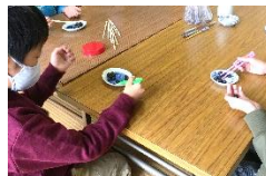
豆を箸でつかむ遊びで、正しい指の使い方を学びました。(かきかた教室)