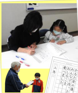
書き方教室3年生 (全5回)