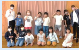
キッズダンス教室 1.2.3年生(全2回)