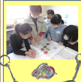
七宝焼でキーホルダー作り教室 (2教室)