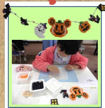
アイロンビーズでオーナメント作り教室 (4教室)