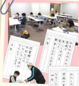
書き方教室4.5.6年生 (全5回)