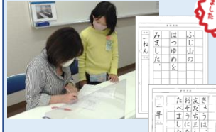
書き方教室1.2年生 (全5回)