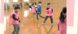
体づくり運動教室 (全2回)