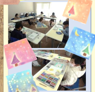
パステルアート教室 (冬期3教室)