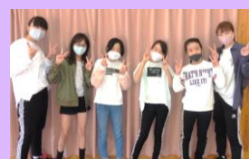
キッズダンス教室 4.5.6年生(全2回)