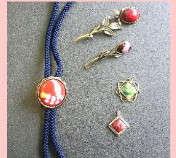
ブローチやループタイなどを作成しました。