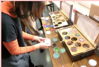
釉薬の中から好みの色を選び、重ねます。

七宝焼(しっぽうやき)は、銅板にガラス質の釉薬をのせて高温で焼成することでエナメル ゆうやく の光沢を出し、アクセサリーなどに仕上げます。その美しい色合いが名前の由来といわれています。