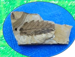
きれいに採集できた化石はシャーレに入れ、標本シールを貼りました。