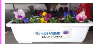
「花いっぱい基里」 基里小ボランティア委員会