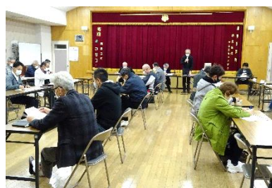
第8回専門(合同)部会 2月13日(金)

令和2年度第8回専門部会では、まち協発足10年目となる来年度の事業について意見交換をしました。