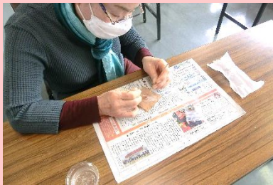
銅製のアクセサリー土台に下引をのせます。