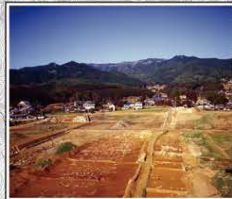
新町町屋跡の発掘状況 勝尾城へと延びる伝登城道に沿って短冊形地割の町屋(掘立柱建物群)が確認されています。