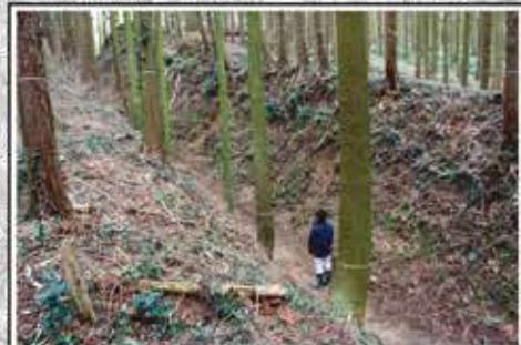
葛籠城の空堀 東西を走る空堀の一部は、西は高取城がある山稜の斜面から東は安良川まで達し、全長700m以上の大規模なものです。