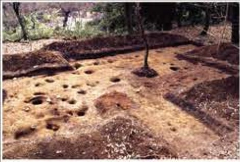
筑紫氏館跡の発掘状況 焼失した建物の柱穴や壁土が確認されました。戦いで焼けてしまったのでしょうか。