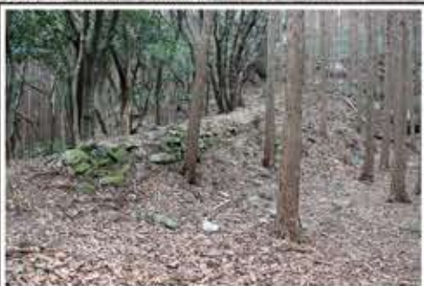
勝尾城の石塁 勝尾城の南西部の防御施設で、長さ約50m、高さ1mの規模を誇っています。