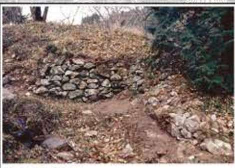
館跡の虎口 枡形状の石垣の虎口(出入口)を見ることができます。館跡の正面口とされています。