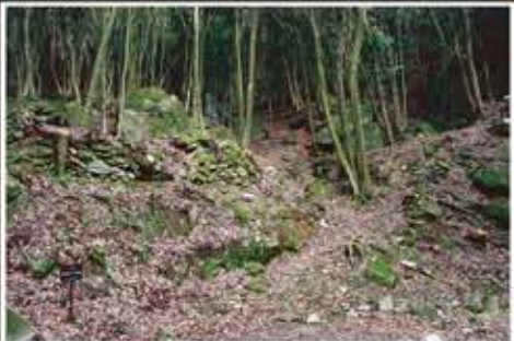
大手曲輪 勝尾城の正面に築かれた曲輪群で、高さ3mに及ぶ石垣を伴う虎口が築かれています。