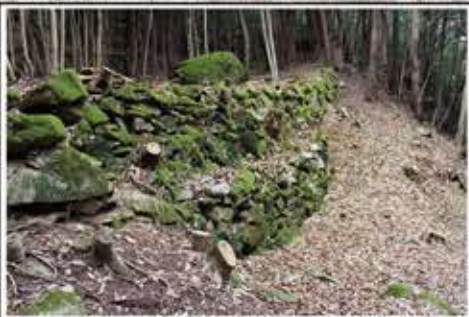
勝尾城の石垣 長径30~60cm大の自然石で築かれています。高さ4m前後の「二段積み」の石垣です。