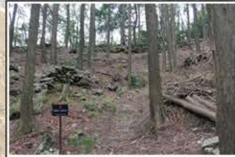
勝尾城伝二ノ丸の虎口及び石塁 東の防御施設で、石塁は長さ約100m続き、枡形状の虎口(出入口)が築かれています。