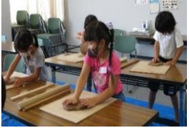
粘土をこねるのも一生懸命