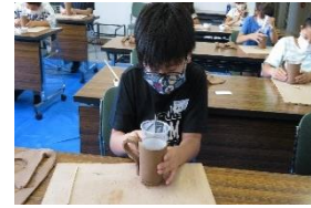
一番難しい取っ手作りに挑戦