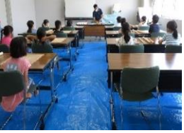
先生のお話真剣に聞くことができました