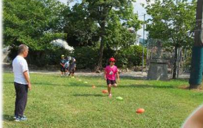
7/27～8/23 夏休み子ども 「かけっこ教室」 中尾先生