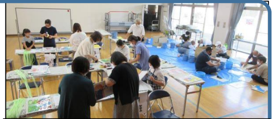
9月4日のパネル作成の様子、31名のまち協役員やご家族が参加されました。