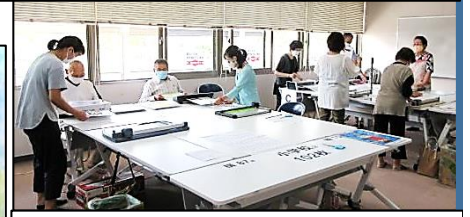
ラミネート加工作業