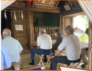
区長さん以下 12 名が参加されました。

9/25(土)10 時より、高田町老松宮で、秋季祭典が行われました。秋季祭典の後、引き続き託宣が行われ、今後の作物や風水害について、神様のお告げをお聞きしたところ、今年の風水害は「少し有」災害が多い昨今、大きな災害がないことをお祈りするばかり。