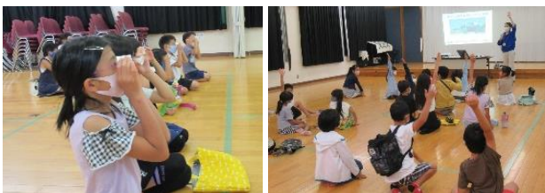
木星や土星などいくつもの星を観察しました。

9/24(金)19 時より、鳥栖地区青少年育成会主催「季節の星を観察しよう」を開催しました。この催しは今年で 3 回目。宇宙科学館の方からお話を聞き、みんなで星座早見表を作りました。その後、外に出て大きな望遠鏡で夜空を見上げ、いくつもの星を観察しました。参加してくれた 21 名の子どものキラキラした表情が印象的でした。