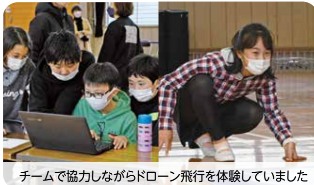
チームで協力しながらドローン飛行を体験していました

パソコンでプログラミングをしたドローンを思い通りに飛行させることにチャレンジするドローン飛行体験が鳥栖小学校で行われました。