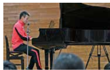
弾き語りを披露した島川選手