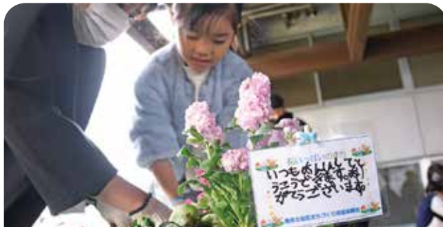
寄せ植えには手書きのメッセージを添えました

鳥栖北小学校の1年生が交通安全指導員や子ども110番の家などの「子ども見守り隊」の皆さんへ日頃の感謝の気持ちを込めて、鳥栖北地区新花いっぱい運動の一環で花の寄せ植えを行いました。