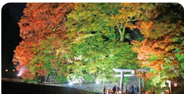
家族連れや友人同士など多くの人を訪れました

河内やまびこ会の活動として、大山祇神社周辺のライトアップが行われ、赤や黄色に染まった古木の紅葉が、竹灯りとともに幻想的な風景を作り出しました。