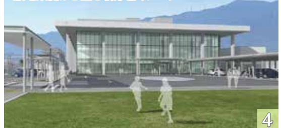
敷地東側から望む新庁舎イメージ