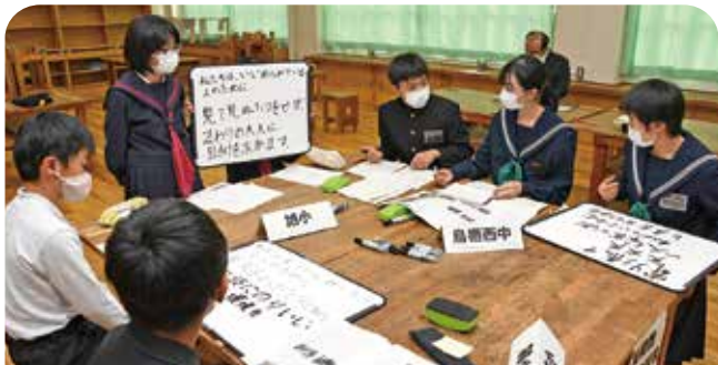
いじめをなくす方法を話し合う児童・生徒たち

いじめを防ぐための取り組み報告や今後について、鳥栖市内の小・中学生が話し合う「なくそう いじめ」子ども会議をオンラインで開催しました。