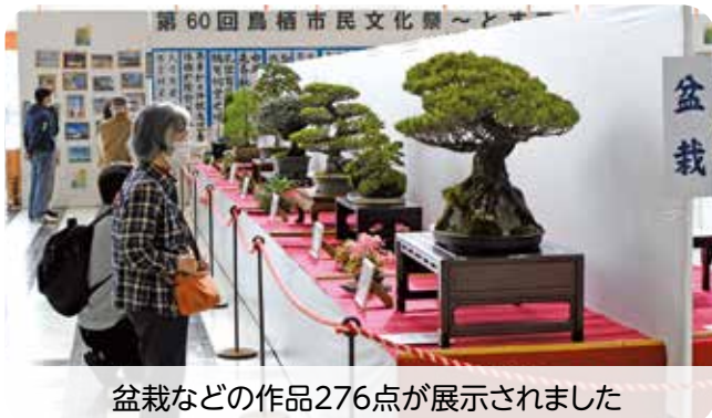
盆栽などの作品276点が展示されました

第60回鳥栖市民文化祭～とすフェス～の展示部門をフレスポ鳥栖1階ウェルカムコートで開催しました。