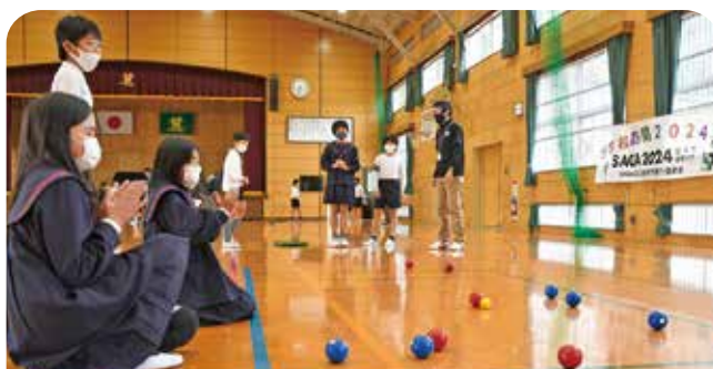
3人チームに分かれて室内ペタンクを体験

2024年に佐賀県で開催されるSAGA2024国民スポーツ大会・全国障害者スポーツ大会を児童に紹介する「学校訪問2024」が麓小学校で行われました。