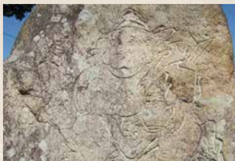
田代小学校前のエビス像