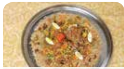
セネガル料理「チェブヤップ」

私の出身地は西アフリカのセネガルです。アフリカ大陸の西の角に位置します。日本の約半分ほどの国土におよそ1600万人が暮らしています。首都はダカールで、ダカールラリー（モータースポーツ）のゴール地点です。気候は熱帯と乾燥帯のため、年中平均気温が20℃を下回することはありません。公用語（教育言語）はフランス語ですが、日常会話は数種の言語が使用されており、複数の言語を話す人がほとんどです。温暖な気候もあり、セネガル人は陽気な人が多く、さまざまに伝統音楽や現代音楽が盛んな地域