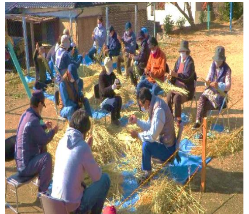
27日のしめ縄わら準備