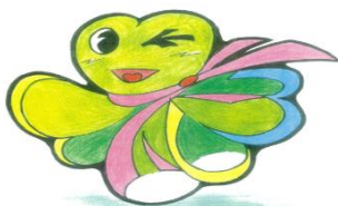
表紙絵 内村正巳・深雪様 作 (田代本町)