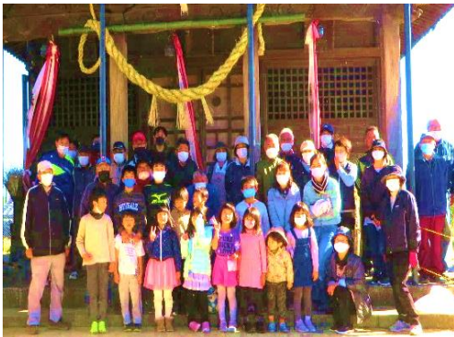
完成したしめ縄を社殿前に奉納し、記念撮影

田代昌町・道祖神社のしめ縄作りを11月27日（土）28日（日）に行いました。27日は、しめ縄用藁準備、28日は、しめ縄を造り社殿前と鳥居に無事奉納しました。両日とも朝8時から8組、9組の皆さん、更に各組から応援の皆さん、子供クラブの皆さんに手伝って頂きました。