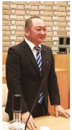
野下泰弘議員 立憲民主党議員団