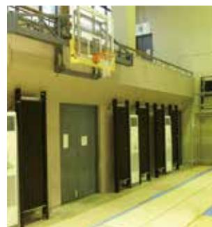
アリーナ輻射パネル

答 市民の優先利用の規定はありません。現状の 体育館の利用頻度も高くなっており、なおかつ 夏に冷房も入るようになりますので、利用につ いては調整しながら対応していきたいと考えています。