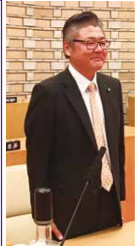
緒方俊之議員 自民党鳥和会