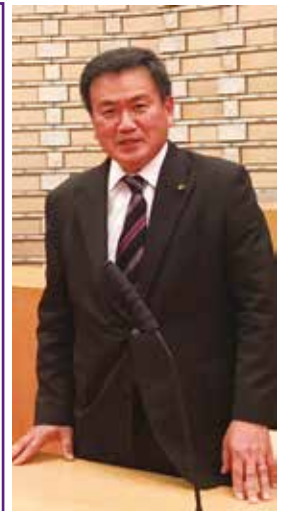
江副康成議員 自民党鳥和会