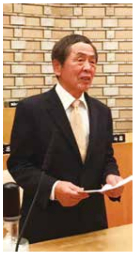
成富牧男議員 日本共産党議員団