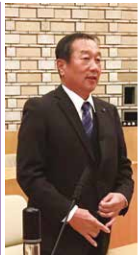
中川原豊志議員 自民党鳥和会