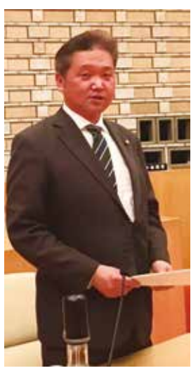
池田利幸議員 公明党