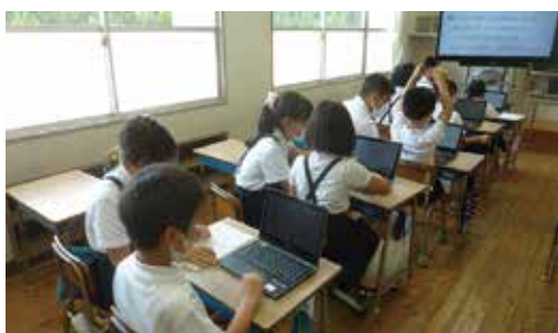
小学校：低学年児童のオリエンテーションで高学年児童が支援をする様子

答 ご家庭での利用は、大きく分けて3つです。1つ目に、家庭学習に活用することで、ドリルや練習問題、授業の中で配信されたもの等の一部を、ご家庭で学習してくるという使い方。2つ目に、臨時休業時等のオンライン通信。3つ目が、不登校やコロナ関連で出席停止などになった子どもさんたちへのオンライン通信です。