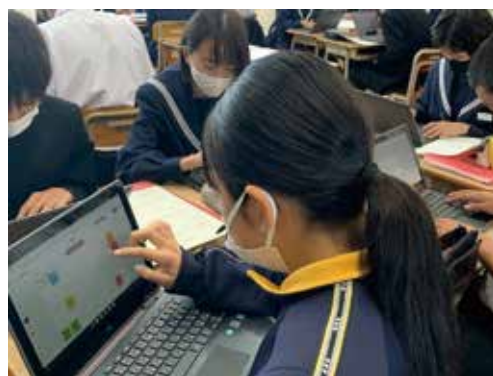
中学校：授業の話合いの様子

答 就学援助世帯の中で、通信環境整備が整っていない世帯へ補助するものです。全学年へのアンケート調査では、通信環境が整っていない世帯が約15%ありました。通信費を除く環境整備に必要な経費、機器購入費や事務手数料等を対象に、就学援助世帯の中で計上をしました。1世帯当たり3,300円の補助で、小学校は165世帯（合計54万5千円）、中学校は48世帯（合計15万9千円）を見込んでいます。