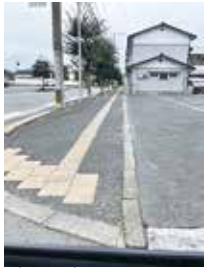
弱視の方には見えないとされる点字ブロック

厳しい経済状況にある方の暮らしを下支えするための「住民税非課税世帯等に対する臨時特別給付金」のほか、「学生支援緊急給付金」も含み、国会審議決定次第、適切に、速やかに対応する必要があると考えております。