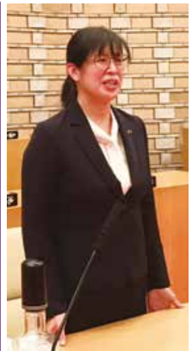
田村弘子議員 立憲民主党議員団