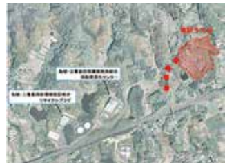
リサイクル施設建設予定地

②進捗状況は、建設用地として立石町と合意され、測量や文化財調査に伴う草刈り・伐採等事業の初期段階で必要となる作業を確認し、関係機関との調整等の準備を進め、今後