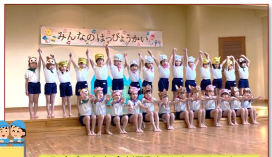
発表会（ビデオ撮影）を行いました！