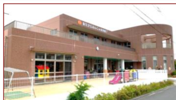
弥生が丘あんじゅ保育園