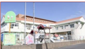
やよいが丘保育園

保育の必要性の認定を受けた乳幼児の心身の発達を助長し、養護と教育が一体となって豊かな人間性、人を思いやる心、自主性、協調性、社会的態度を養い、より良い環境の中で健やかに育成します。