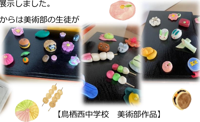
【鳥栖西中学校 美術部作品】

麓小学校からは理科の研究発表動画と、実際に作られた泥団子の作品の展示をしていただきました。サークル活動などでセンターに来所された方が観覧され、「子どもたちの発想が面白い！」と感心されてありました。