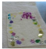
<センター事業・旭まちづくり推進協議会 担い手育成：親子竹灯籠づくり>