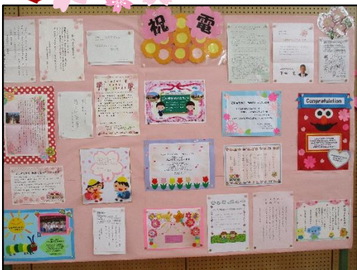
卒園した幼稚園や保育園などからの祝電