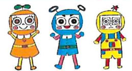
市民活動シエン隊「できるんじゃー」