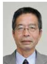
尼寺省悟 (日本共産党議員団)