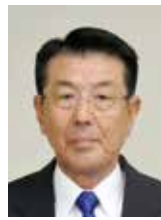
中村直人 (社会民主党議員団)