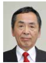
成富牧男 (日本共産党議員団)