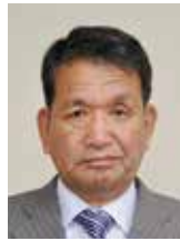
内川隆則 (社会民主党議員団)