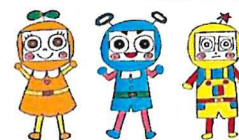
市民活動シンエン隊「できるんじゃー」