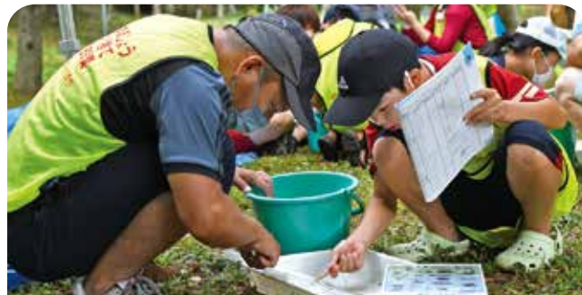
どんな生き物が採れたかを熱心に話し合う親子

河内ダム上流の大木川で「親子で川の生き物調査隊」を開催しました。参加した親子は、川に入って石の裏などに潜む小さな虫や魚などを素手や網を使って収集した後、資料と見比べながらどんな生き物が採れたかを確認。調査の結果、ヒラタカゲロウ類などきれいな水質を好む生き物が多くすんでいることが報告され、環境対策課の職員は「今後もこのきれいな川を維持していきましょう」と呼びかけました。