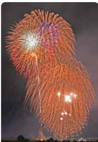
筑後川花火大会【8月5日（金曜日）】

鳥栖山笠（先月号表紙）にはじまり、まつり鳥栖（24ページ）や筑後川花火大会など、今年の夏は3年ぶりにさまざまな催しが開催され、久しぶりの夏の風物詩を楽しんだ人も多いかと思います。私自身もウキウキしながら写真を撮っていたのですが、スペースの都合上、残念ながら全てを市報に掲載できませんでした。全く表に出せないのも悔しいので、花火大会の写真をこちらに掲載します。（辰）