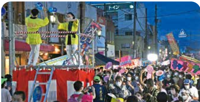
外国人留学生など多くの人に参加した市民総踊り

鳥栖の夏祭り・まつり鳥栖が「夏・みんなの架け橋」をテーマに3年ぶりに開催されました。例年よりもコースを短縮して行われた市民パレードには、サガン鳥栖や久光スプリングスなど9団体が参加。沿道には多くの露店が並び、フレスポ鳥栖と中央公園にはステージが設置され、ダンスや歌、演奏などが披露されました。夕暮れ時から市民総踊りもスタート。浴衣などに身を包んだ来場者は、久しぶりのにぎやかな雰囲気を楽しんでいました。