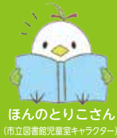
ほんのとりこさん (市立図書館児童室キャラクター)