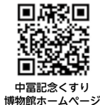
中富記念くすり博物館ホームページ