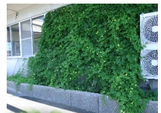
ゴーヤの グリーンカーテン