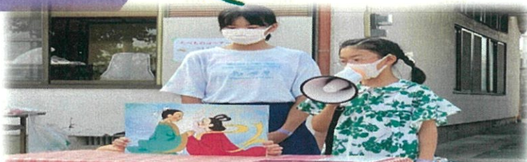
紙芝居「天の川のはなし」