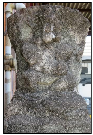
西町エビス（東側） 野下ポンプ店