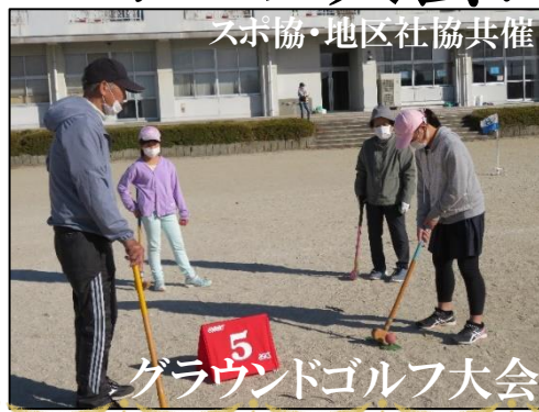
5 グラウンドゴルフ大会