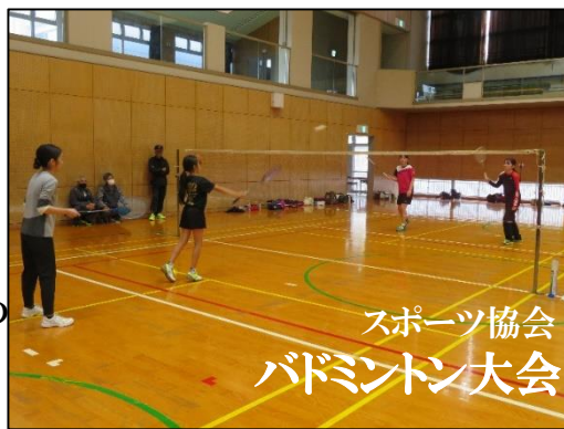
スポーツ協会 バドミントン大会

11月6日(日)にグラウンドゴルフ大会、13日(日)にバドミントン大会をそれぞれ鳥栖北小学校で開催しました。楽しく体を動かし、賑やかな歓声の中、無事に2大会は終了しました。参加者の皆さま、お疲れ様でした。なお、ペタンク大会は雨天の為残念ながら中止となりました。