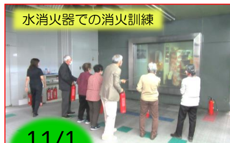
水消火器での消火訓練

福岡市民防災センター(防災体験等)、福岡市鮮魚市場(DVD講習)での研修に約20名が参加されました。