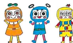
市民活動シエン隊「デキるんじゃー」