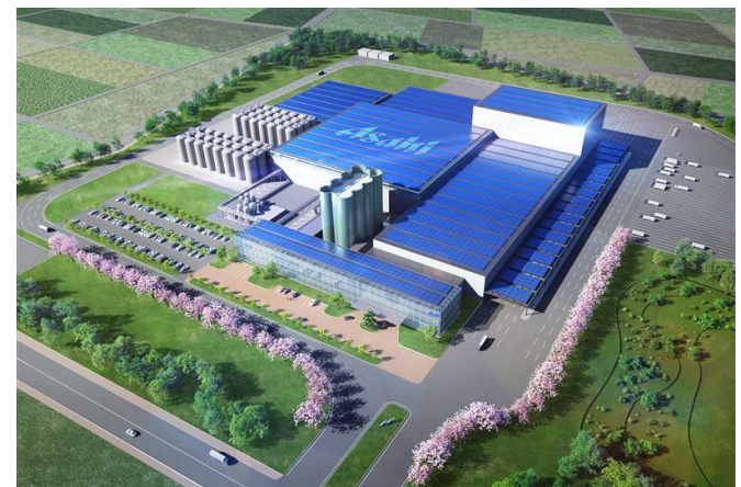
新九州工場（仮称）のイメージ