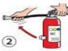
② ホースを火元に向けます