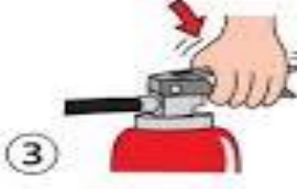
③ レバーを強く握ります